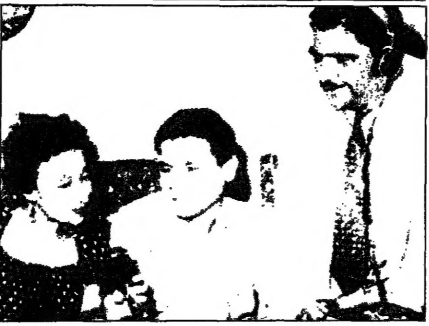
صورة تعود الى العام 1954 وفيها الانامية امن فيمي شمس تحت لحنه